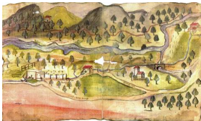
LES MOULINS DE DARDENNE – CARTE IMAGÉE DU 26 AOÛT 1602