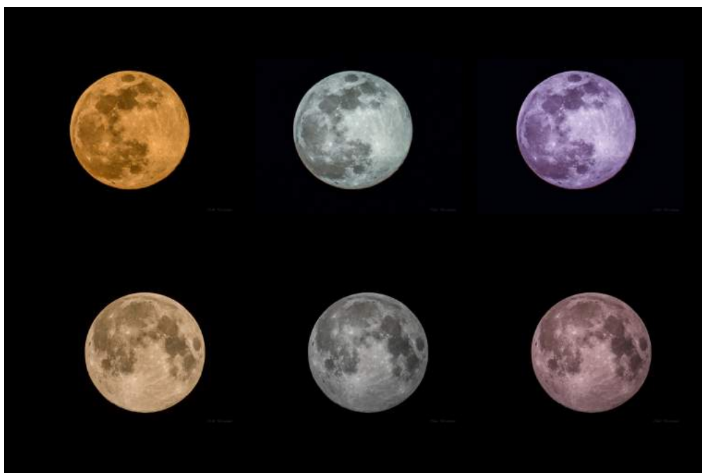
LA PLEINE LUNE DU 7 AVRIL

Et pour rêver, garder le moral, songer à l'après, quand nous pourrons de nouveau arpenter nos collines, des photos de Cécile pour la pleine lune exceptionnelle dans la nuit du 7 au 8 avril 2020, phénomène astronomique baptisé Super lune (au plus proche de la Terre : 357 000 km). Des lunes du début de soirée : 1ère ligne - Des lunes de 04h30 : 2e ligne - Le cratère est passé de la droite vers la gauche. Certes, l'interprétation colorimétrique de certaines lunes est plus poétique que réaliste. Au lever, elle est jaune orange, en milieu de nuit, blanche, ça c'est du réel. Les autres versions rosées sont un clin d'oeil au surnom de cette super lune qui se produit au printemps, période de floraison des cerisiers et autres ... aux fleurs roses. D'où son surnom de lune rose. Car à aucun moment, elle n'est devenue rose. Légende amérindienne ?