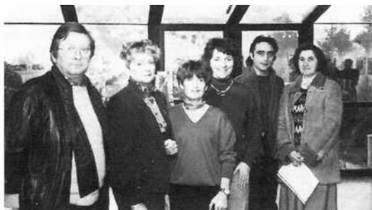
Equipe des Comoni.

En janvier 1991 un conseil d'administration de la Maison des Comoni est créé ainsi qu'une association de gestion qui comprend 9 membres.