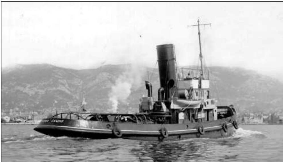
Le remorqueur Mont-Caume dans le port de Toulon en 1949