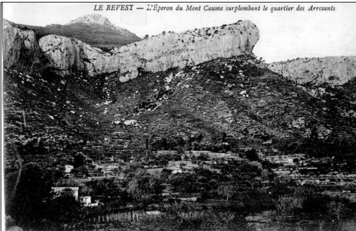
Caomé au Revest-les-Eaux