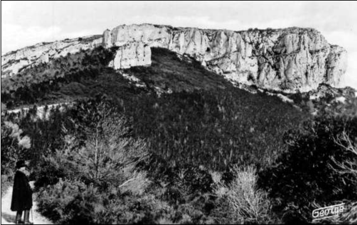
La Caume de Saint-Rémy-en-Provence (altitude : 384 mètres)