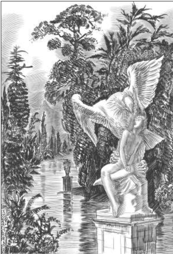
Gravure réalisée par Decaris pour ce poème.

Eh quoi ! Dans cette ville d'eaux, Trêve, repos, paix, intermède, Encor toi, de face et de dos, Beau petit ami Ganymède,